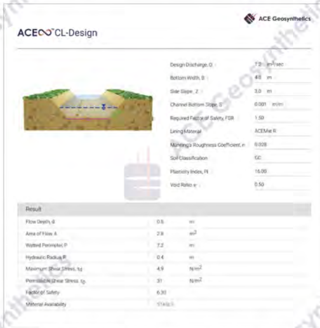
Ejemplo de informe para ACEoo™CL Design

ACEoo™CL-Design, la herramienta de diseño en la página oficial de ACE Geosynthetics, es recomendada con el uso de ACEMat™ R Series, para la evaluación preliminar del revestimiento de canales. El análisis cumple con las pautas de la Administración Federal de Carreteras (FHWA)